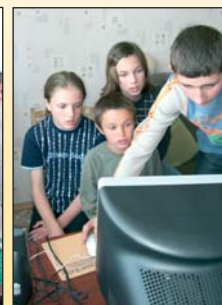
Kinder in Antonovka freuen sich über den gespendeten PC